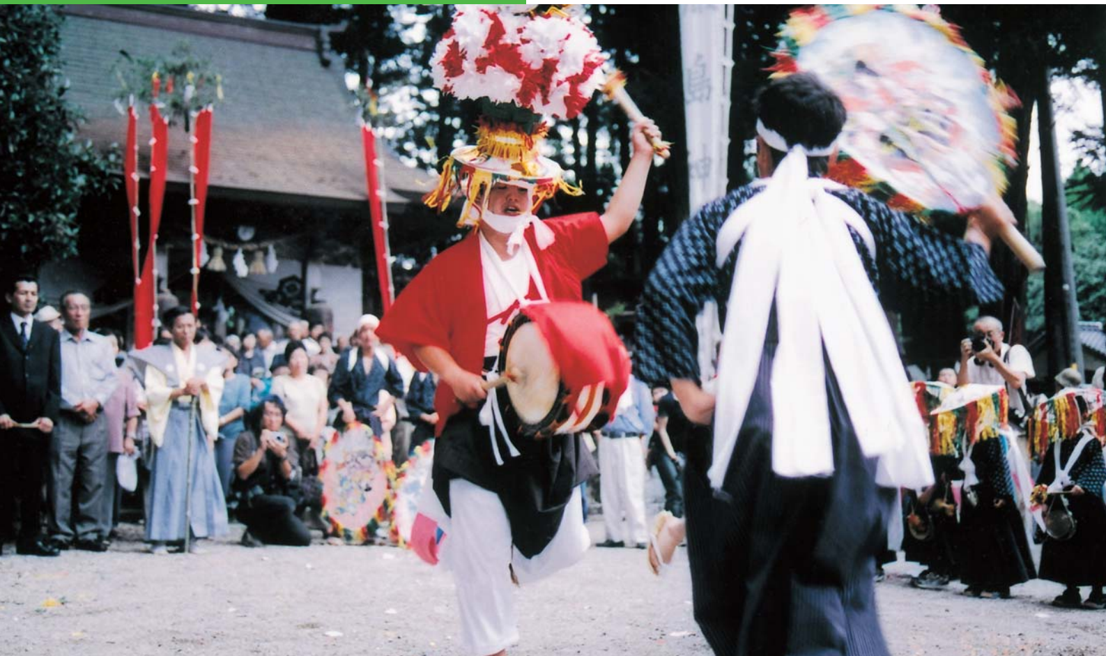
(美祢市秋芳町 別府巖島神社)